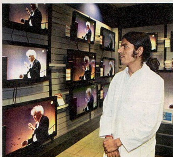
ANI TOHLE NEZNAL. Před třemi lety si koupil v Káthmándú svou první televizi s úhlopříčkou 15 centimetrů. Pražské obchody s elektronikou ho šokovaly.